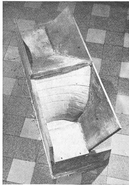
Fig. 23. — Modèle en plâtre. Recherche d'une surface libre à trois dimensions.

Mais quand il s'agit de problèmes tridimensionnels, ni l'une ni l'autre de ces méthodes ne convient et il faut faire appel soit à la méthode des réseaux, que nous