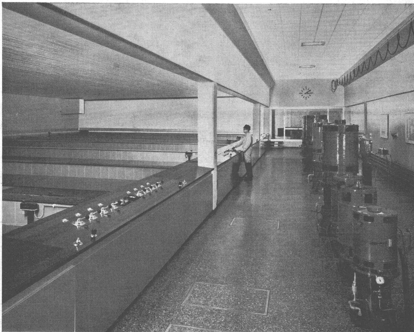
Station de filtres rapides «Champ-Bougin» de la ville de Neuchâtel ayant un débit de 1800 m 3 /h. A droite, les moteurs d'entraînement des pompes