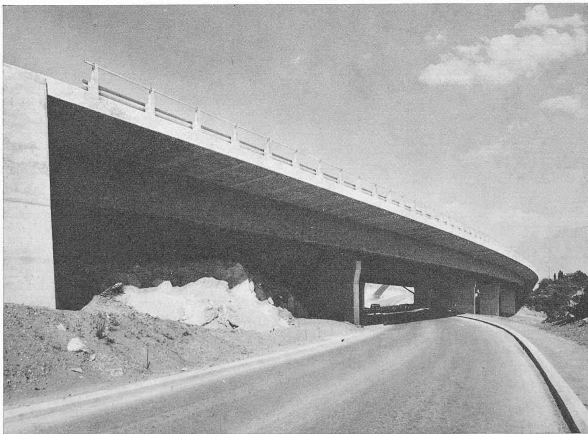
Fig. 1. — Les ponts de la Salenche surplombant la correction de la route cantonale 763. La vue est prise en direction de Chardonne.

La Salenche a été corrigée entre deux ponceaux existants à l'amont et à l'aval du remblai exécuté sur une longueur de 100 m environ. Elle passe dans un canal rectangulaire en béton armé. Le gabarit d'espace libre brut choisi est