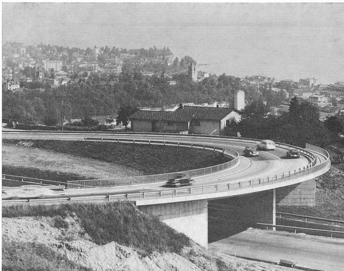
Fig. 1. — Le pont de Beau-Site et la route cantonale n° 744 ; au fond : Vevey.

En effet, les deux tronçons de la nouvelle route se coupent en formant un angle de 25^\circ dont le sommet est situé sur l'autoroute. La topographie des constructions existantes a obligé de réaliser le raccordement par un cercle de 50 m de rayon, sur lequel vient se placer l'ouvrage décrit ci-après.