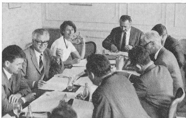
Fig. 2. — Vue générale de la conférence.