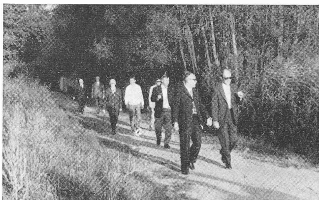
Fig. 9. — Walk and talk ou, selon un principe reconnu dès l'Antiquité, la promenade, source de stimulation intellectuelle.