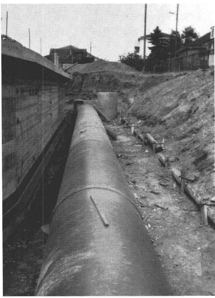
Commune de Bussigny près Lausanne Collecteur d'eaux de surface \varnothing 125 cm