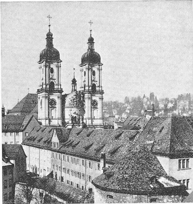
Tours de la collégiale de Saint-Gall. Au 1 er plan, un corps de bâtiment de l'ancien couvent avec des restes de fortifications et la dernière tour de défense.

grâce à son intéressante structure architecturale que maintes villes plus grandes lui envient. Après un apéritif offert par la ville de Saint-Gall, tout le monde s'installa dans la grande salle de spectacle où l'on joue d'habitude des opéras, opérettes et pièces de théâtre. Cette fois, on entendit tout d'abord une allocution de notre président, M. A. Cogliatti, qui exposa de manière claire et impressionnante les problèmes marquant la marche de la Société orientée par les nouveaux statuts. Cette revue générale, comportant des éléments dont certains membres n'avaient peut-être jusqu'ici pas clairement mesuré la portée, fut certainement utile pour tous 1 .