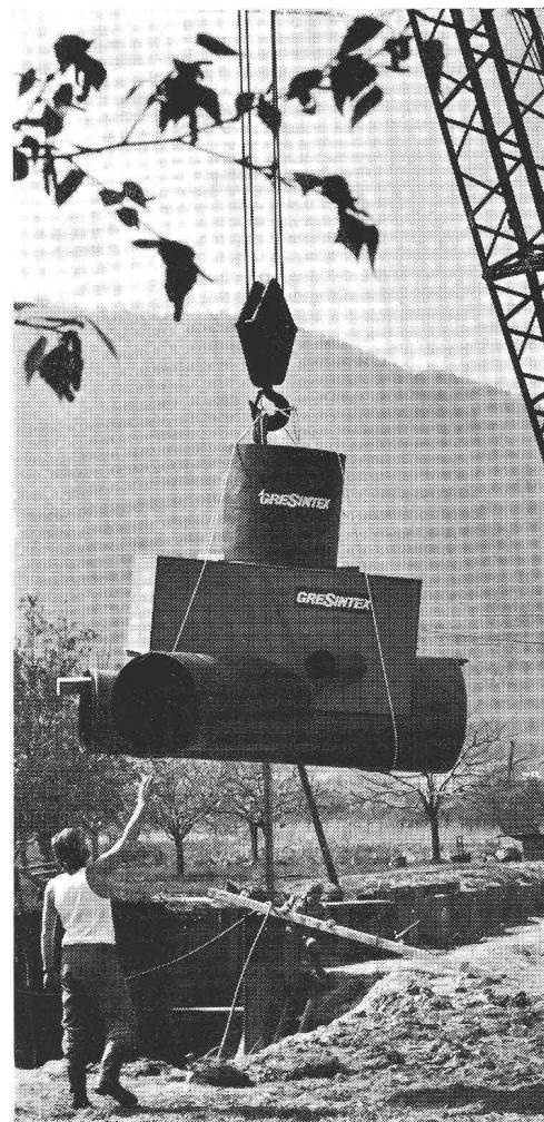
Chambre en PVC GRESINTEX, utilisée comme coffrage perdu dans le cas de collecteurs posés dans la nappe phréatique.