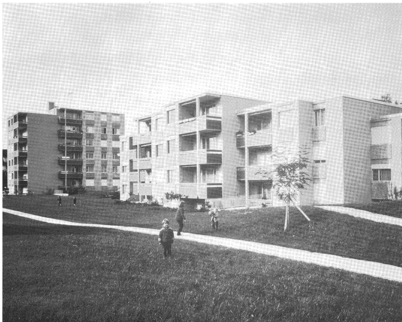
Voir page 246 du présent numéro.

SIKAPLAST, le revêtement de surface prêt à l'emploi, à base de résines artificielles, pour l'utilisation extérieure et intérieure. SIKA SA, 8048 Zurich.