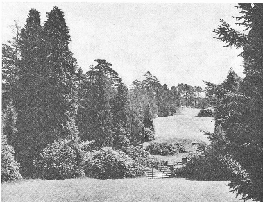
Exemple de réussite d'un arboretum: Bedgebury, Kent/GB.