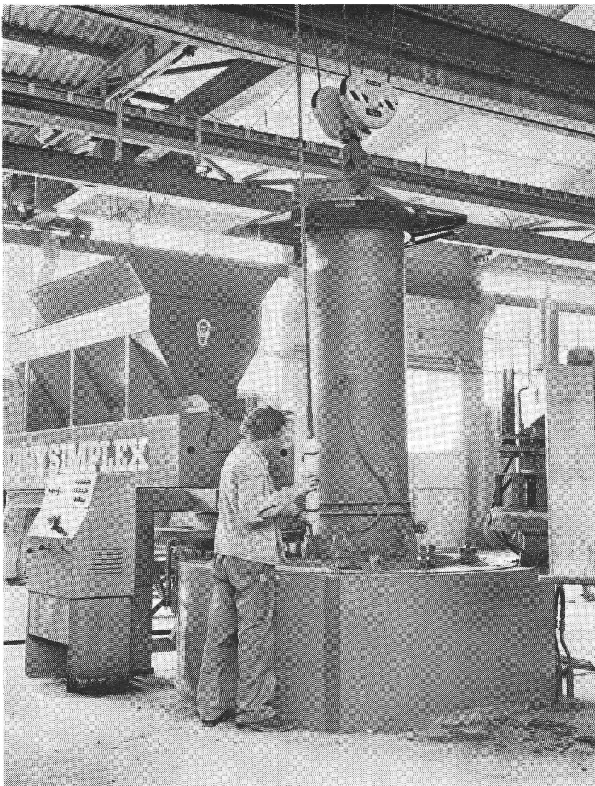
Voir page 430 du présent numéro.