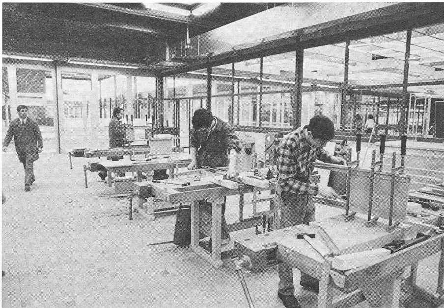
Fig. 6. — Atelier des ébénistes.

service échelonné, il sera possible d'assurer quotidiennement un plus grand nombre de repas.