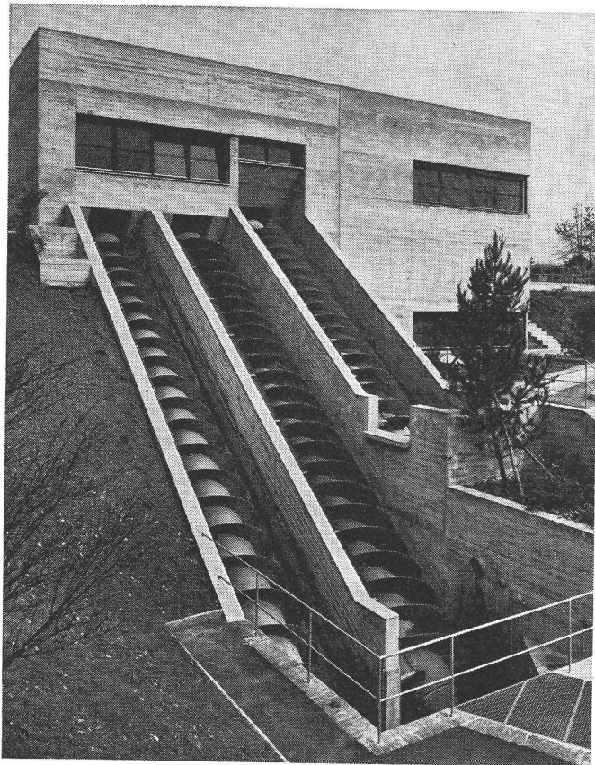
Station d'élévation pour eaux usées avec vis d'Archimède dans l'installation d'épuration de la ville d'Olten.

Les engins d'élévation avec vis d'Archimède SPAANS constituent la solution idéale pour le refoulement d'eaux usées brutes et de boue. Les vis d'Archimède SPAANS sont fabriquées depuis plus de 50 ans et se caractérisent par leur robustesse et leur fiabilité.