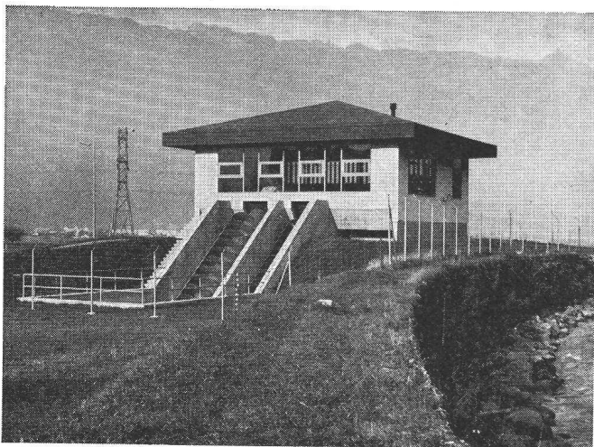
Station de relevage des eaux de décharge de la commune de Wilderswil.