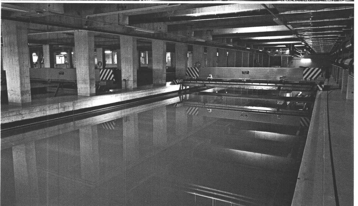
Station d'épuration des eaux à Vevey