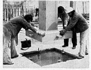
Montage de colonnes du centre interurbain des PTT à Zurich- Herdern: De lourdes colonnes doivent supporter les bâtiments élevés à grandes charges utiles de plancher.

Geilinger Constructions métalliques SA, avec ses ingénieurs expérimentés, ses usines modernes et ses équipes de montage œuvrant la main dans la main, vous donne l'assurance d'une réalisation en charpente métallique rapide et économique: votre projet ne finira pas comme la tour de Babel.