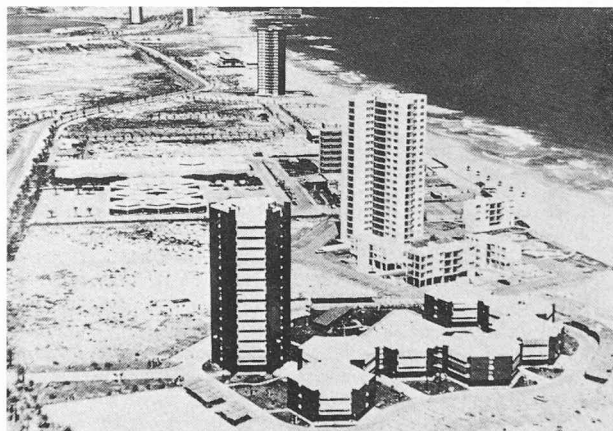
... entre d'autres façades de béton

Un élément qui aggrave les conséquences du tourisme de masse résulte des efforts frénétiques d'exploiter au maximum ce pactole. L'urbanisation des sites touristiques s'est le plus souvent faite sans aucune réflexion ou concertation, le temps faisant défaut pour les préoccupations architecturales et sociologiques. C'est pourquoi le citadin alléché par les sites enchanteurs des prospectus touristiques quitte trop souvent la foule et le béton de sa ville pour se retrouver dans une autre foule, entre d'autres façades de béton. Alors que nombre de grandes villes réservent au piéton des artères où flaner, les stations touristiques à la montagne ou à la mer sont encombrées d'inextricables embarras de circulation motorisée.