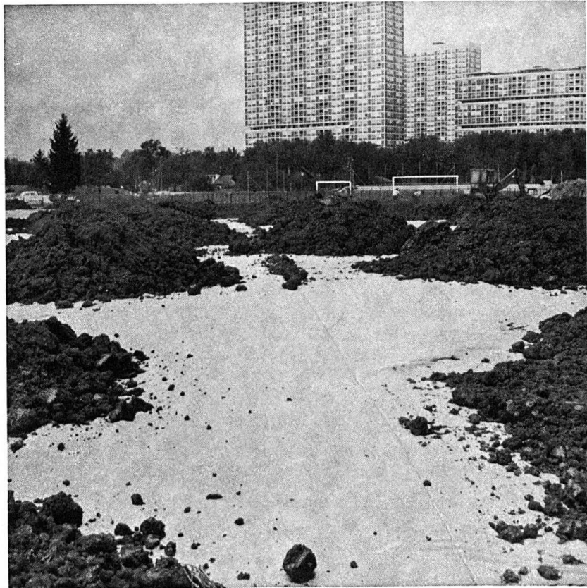
Un exemple d'application de BIDIM sur un terrain de sports : CENTRE SPORTIF D'AÏRE-GENÈVE

Filtrations, drains, enve- loppes de drains, etc.