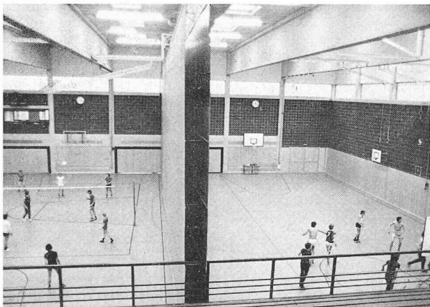
Fig. 1. — Vue intérieure de la halle de sport de Paderborn.

celui-ci : 70 000 m 3 ), dans les eaux usées qui s'écoulent de la piscine et des douches et dans l'air vicié extrait de la halle de la piscine. La chaleur fournie pour le chauffage et la préparation d'eau chaude du centre sportif correspond à 182 % de l'énergie primaire (gaz naturel) dépensée. Un chauffage conventionnel à gaz, avec chaudière, n'a qu'un rendement pratique de 80 % environ ; l'économie d'énergie atteint donc 56 %. Un calcul comparatif établi avant le choix définitif d'un système de chauffage avait montré que la pompe à chaleur à gaz présente des avantages marqués sur la pompe à chaleur à moteur électrique, la consommation d'énergie de cette dernière étant estimée à 1,6 fois celle de la pompe à chaleur à gaz ; un chauffage conventionnel combiné à une pompe à chaleur électrique pour la récupération de la chaleur aurait entraîné une dépense d'énergie encore plus élevée, presque double.