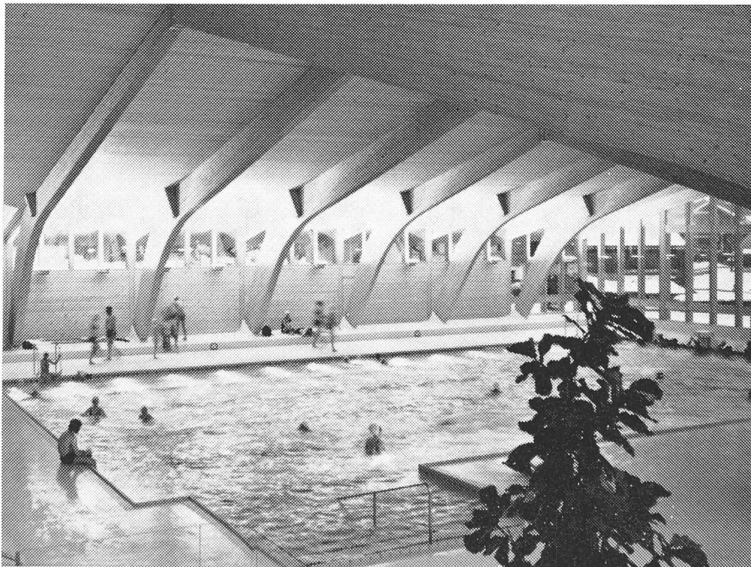
Les piscines dans lesquelles le baigneur recherche le repos et la détente doivent être confortables. On parvient à remplir cette condition en employant le bois, matériau qui répond également aux exigences de la physique du bâtiment. Le rayonnement naturel du bois est un stimulant qui prédispose au mouvement et à l'activité sportive.

Le tennis appartient à la catégorie des sports qui s'est le plus développée ces dernières années. Ce sport autrefois réservé à une élite est devenu l'une des occupations les plus appréciées pour les loisirs, d'une part à cause de l'attrait de ce jeu, et d'autre part par sa pratique répandue, en toute indépendance de l'âge et du sexe. La preuve de ce courant d'intérêt pour le tennis réside dans l'importance quantitative des membres de l'Association suisse de tennis (environ 100 000) qui, par rapport à 1961, a quadruplé. Ainsi, du point de vue du nombre de ses affiliés, l'Association suisse de tennis occupe-t-elle le quatrième rang parmi les associations sportives de notre pays. Ce remarquable développement entraîne implicitement un manque considérable de terrains de tennis, ce qui peu à peu atténue l'enthousiasme des amateurs de ce sport, contraints à de longues attentes pour pouvoir jouer. Si l'on veut remédier à cette situation et perpétuer la popularité de ce sport, il devient nécessaire de porter une attention particulière à l'étude et à la réalisation de nouveaux courts de tennis. Par là, il faut également entendre la construction de halles qui permettent la pratique de ce sport quels que soient le temps et la saison. Les halles gonflables sont et resteront des solutions provisoires, et c'est pourquoi aujourd'hui elles sont pratiquement toutes remplacées par des constructions en « dur ». Il est intéressant de constater que l'on