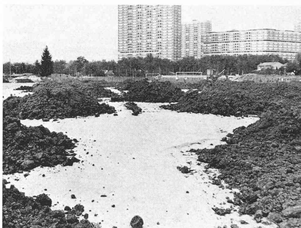
Mise en place de la terre végétale sur les nappes de Bidim, le sol étant préalablement nivelé et recouvert de grave.

La couche de surface se compose de terre végétale, d'une épaisseur de 15 à 20 cm, allégée par du sable naturel lavé 0/8.