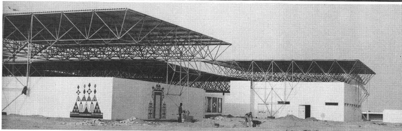
3000 m 2 de structure spatiale Varitec pour un centre d'exposition en Maurétanie Architecte et ingénieur: Itten + Brechbühl SA, Berne Entreprise générale: COMETE S.A., Nouakchott, Maurétanie