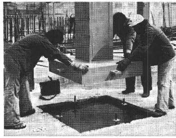
Montage de colonnes du centre interurbain des PTT à Zurich-Herdern: De lourdes colonnes doivent supporter les bâtiments élevés à grandes charges utiles de plancher.

Geilinger Constructions métalliques SA, avec ses ingénieurs expérimentés, ses usines modernes et ses équipes de montage œuvrant la main dans la main, vous donne l'assurance d'une réalisation en charpente métallique rapide et économique: votre projet ne finira pas comme la tour de Babel.