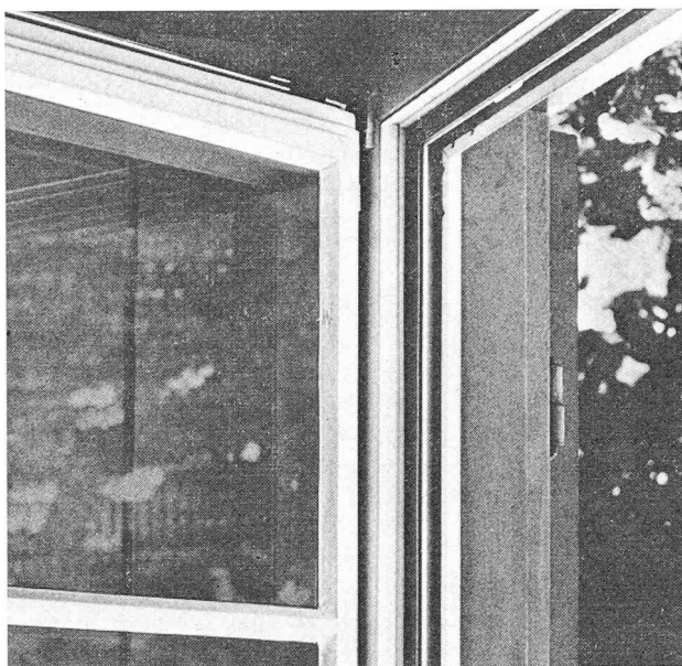
Fig. 3. — La nouvelle fenêtre à cadre rapporté est mise en place. On distingue le double vitrage et le cadre en profilé d'aluminium avec joint périphérique intérieur en caoutchouc pour améliorer l'isolation et la sécurité à la pluie battante.

partiel de plus de 150 familles. Un nouveau type de fenêtre à cadre rapporté a permis de parvenir à une heureuse solution. L'entreprise chargée de ce travail dispose depuis plusieurs années d'une équipe de spécialistes de la rénovation qui ont développé une fenêtre à cadre rapporté permettant de conserver l'ancien dormant et de remplacer rapidement le vantail, ce dernier étant conçu selon les plus récentes connaissances en la matière. Le procédé est simple au point qu'il est possible de rénover 8 à 10 fenêtres par maison en une journée de travail. La chose est réalisable du fait que tous les travaux préparatoires sont exécutés en usine et que sur le chantier la fenêtre doit uniquement être montée. Le montage consiste à revêtir l'ancien dormant d'un cadre en aluminium, à étanchéifier les joints entre le cadre et la maçonnerie avec une masse de scellement à élasticité permanente, et à poser le nouveau vantail (avec les trois petits bois caractéristiques) à double vitrage et joint d'étanchéité périphérique intérieur en caoutchouc.