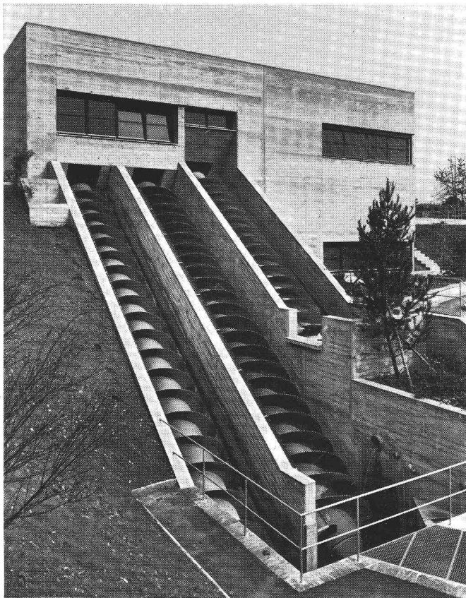
Station d'élévation pour eaux usées avec vis d'Archimède dans l'installation d'épuration de la ville d'Olten.

Les engins d'élévation avec vis d'Archimède SPAANS constituent la solution idéale pour le refoulement d'eaux usées brutes et de boue. Les vis d'Archimède SPAANS sont fabriquées depuis plus de 50 ans et se caractérisent par leur robustesse et leur fiabilité.