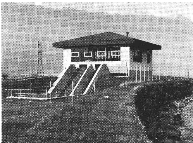
Station de relevage des eaux de décharge de la commune de Wilderswil.