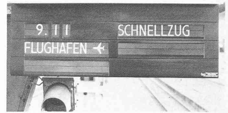
Fig. 5. — Affichage des départs de train à Zurich-Oerlikon.

L'installation des indicateurs de départ (type Solari) contrôlée par ordinateur, comprend 24 appareils d'affichage à Oerlikon (fig. 5), 8 à Wallisellen ainsi que 48 appareils simples et 3 appareils collectifs pour informer les voyageurs. A Oerlikon et dans toutes les gares du rayon d'action, des haut-parleurs sont installés, contrôlés soit localement soit