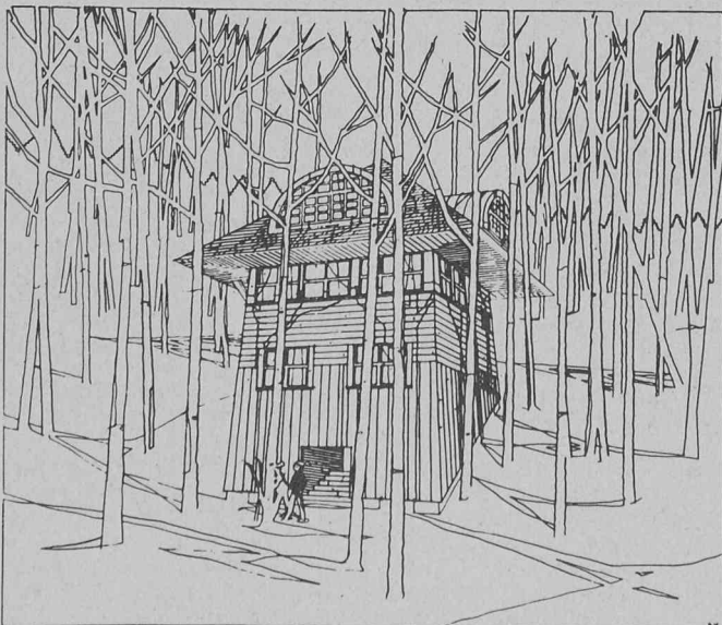
Venturi et Rauch: Brant-Johnson House, Vail (Colorado), 1976.

13 au 27 mai 1981: Venturi et Rauch, exposition du Kunstgewerbemuseum à Zurich réalisée par Stanislas von Moos. 10 au 25 juin 1980: Jacques Favre, architecte, 1921-1973. Décédé en 1973, Jac-