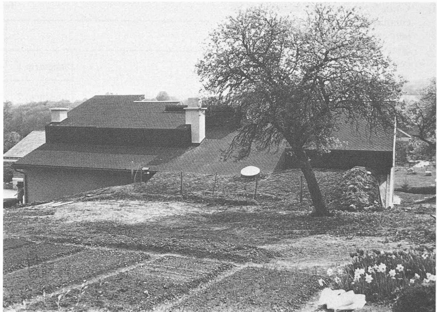
Fig. 3. — Vue prise du nord.

L'excédent dans la serre est particulièrement sensible en octobre, mars, avril et mai. Ce résultat dans notre climat est favorable, puisque pendant ces mêmes mois le gain direct par les façades sud est plus faible. Cet excédent constitue une source de chaleur gratuite pour les deux habitations.