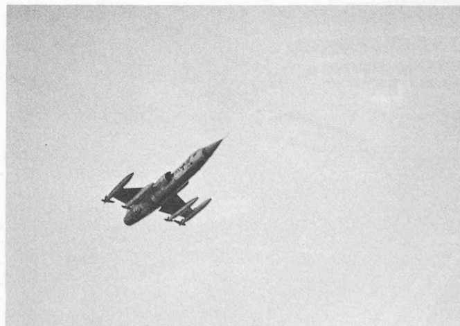
La contribution de Jakob Ackeret au développement de l'aviation supersonique a été immense. Le premier avion opérationnel volant à deux fois la vitesse du son: le Lockheed F-104 Starfighter.

Le défunt a toujours suivi avec grand intérêt les progrès de la science et de la technique, en particulier dans le domaine de la physique moderne. Par ses travaux sur la théorie relativistique des fusées, il a étudié et déterminé clairement les limites physiques de la navigation cosmique dues à la propulsion.