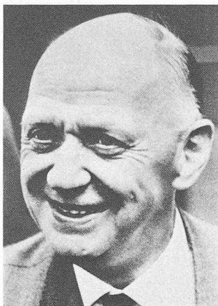
Jakob Ackeret 1898-1981

Le 26 mars 1981, quelques jours après son 83 e anniversaire, Jakob Ackeret nous a quittés, après une longue maladie. Nous avons perdu en lui un savant de renommée internationale et un des ingénieurs qui a le plus marqué la technique et la science de notre temps.