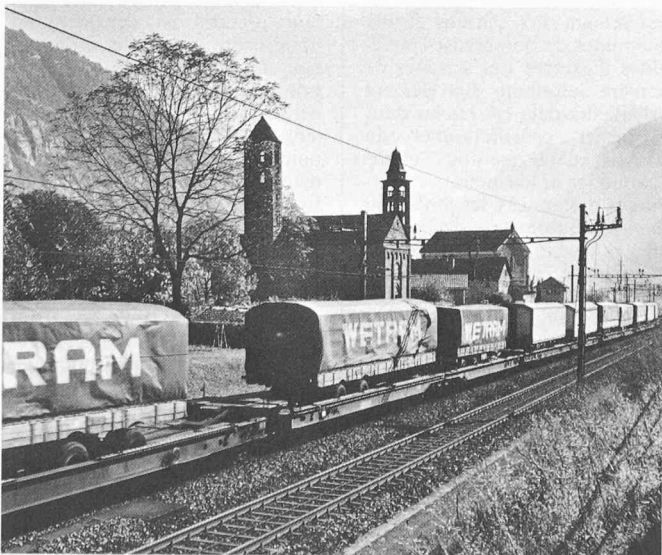
La coordination des transports et l'économie d'énergie sont étroitement liées: le ferroutage en est un excellent exemple.

Le contrat d'entreprise qui vient d'être établi définit la mission des CFF et les diverses prestations de service public qu'ils sont tenus de fournir ainsi que la façon d'indemniser équitablement celles-ci. Pour le reste de leur activité de transport, il doit bénéficier de la plus grande liberté commerciale possible, afin qu'ils parviennent au mieux à une ges-