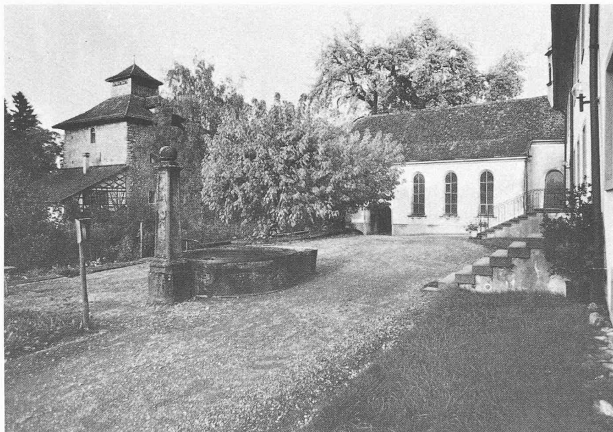
Pfäffikon-Unterdorf (commune de Freienbach) SZ, cas particulier d'importance nationale. Ce groupement minimal composé d'une chapelle, d'un château et de l'ancienne résidence du gouverneur, bordant la partie supérieure du lac de Zurich, a reçu une classification en tant que cas particulier d'importance nationale. Cette classification se justifie par le fait que la relation entre les bâtiments — importants sur le plan de la conservation des monuments — et leur environnement peut être garantie en premier lieu par un instrument de la sauvegarde des sites. L'ISOS se prête particulièrement bien à l'appréhension de cette qualité.

Zoug et dans les deux demi-cantons de Bâle, les sites construits ont été évalués dans un district au moins. Cela ne signifie cependant pas que tous les cantons ont déjà été inventoriés, ni même que les relevés des sites construits sont déjà prêts à être mis en consultation. Outre les inventaires mis en vigueur dans les cantons de Genève, Zurich, Obwald, Schwyz et Uri, le processus de consultation est engagé dans les cantons de Neuchâtel, Glaris et Appenzell et prévu pour 1982 dans les cantons de Schaffhouse, Argovie, Lucerne, Valais, Soleure et dans l'Oberland bernois.