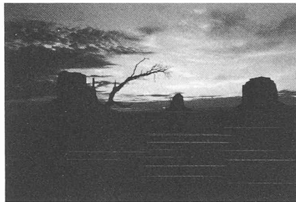
L'Amérique des films de cow-boys!

J'ai suivi des exposés concernant le génie médical, par intérêt personnel pour l'interaction entre la médecine et les sciences de l'ingénieur, par exemple lorsqu'il s'agit de déterminer les contraintes dans un os, où l'on applique à un problème médical les méthodes d'investigation qu'on nous enseigne à l'EPFL. Il y a là matière à un dialogue entre l'ingénieur et le médecin, sans qu'il y ait subordination de l'un à