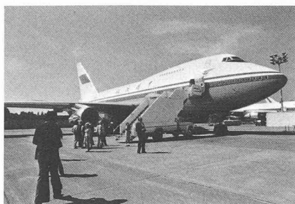
Le Boeing 747 SP

Ce qui m'a aussi frappé, au MIT, c'est la grande différence entre les moyens à disposition de l'enseignement, qui m'ont semblé fort sommaires, et ceux destinés à la recherche, très modernes et complets.