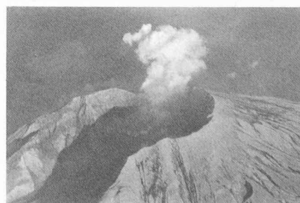
L'éruption du Mont St. Helens vue d'avion.

Cette conférence durait 2 semaines et était en fait très compartimentée, se répartissant simultanément en différents points, ce qui obligeait à des choix.