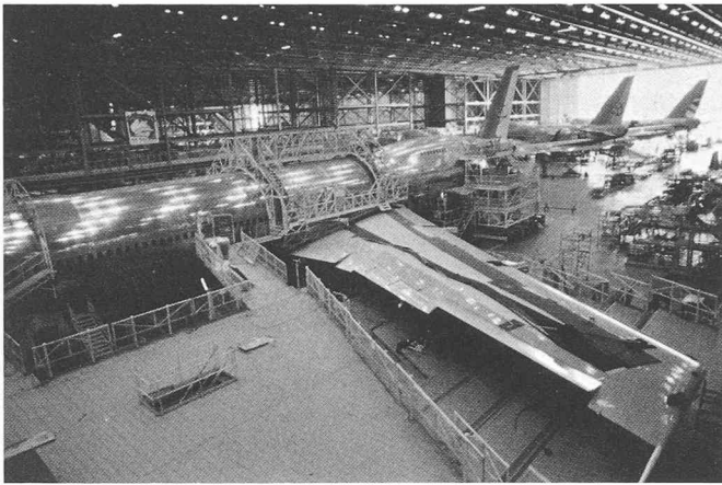
La halle de montage des Jumbo Jets.