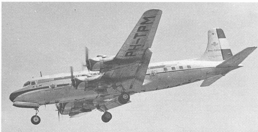
Fig. 7. — Comme le DC-1, le DC-4 s'est révélé capable de développements conduisant à la naissance de toute une série de types. Ici, le DC-6A, à cabine pressurisée.

rie de types plus grands, plus rapides et plus puissants en a été développée, soit les DC-6 et les DC-7, chacun comportant différentes versions, toutes équipées de cabines pressurisées, contrairement au DC-4.