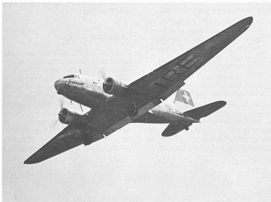
Fig. 1. — L'avion qui a fait connaître le nom Douglas dans le monde entier: le DC-3. La photographie représente l'un de ceux acquis avant la guerre par Swissair et qui a repris du service pour de longues années après le conflit.

L'essor de l'industrie créée par Douglas ne date pas du DC-3; il nous paraît intéressant d'en rappeler ici quelques étapes marquantes.