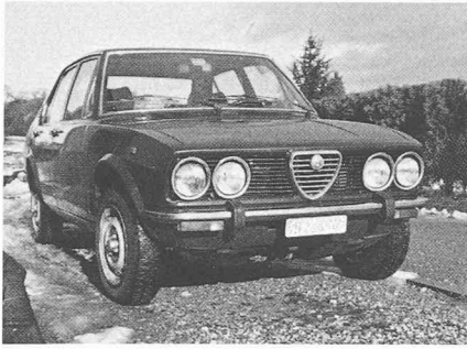
Alfa Romeo: un nom prestigieux, des qualités indéniabiles, une gestion discutable (des milliers de voitures vendues au-dessous du prix de revient), un environnement social troublé, une productivité minable. Le seul salut viendra-t-il du pays du Soleil-Levant?

millions d'Européens dépendent, directement ou indirectement, de l'automobile.