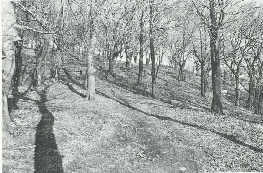
Una bella selva castanile. Esse erano un tempo molto frequenti attorno ai villaggi, oggi sono molto più rare da incontrare.