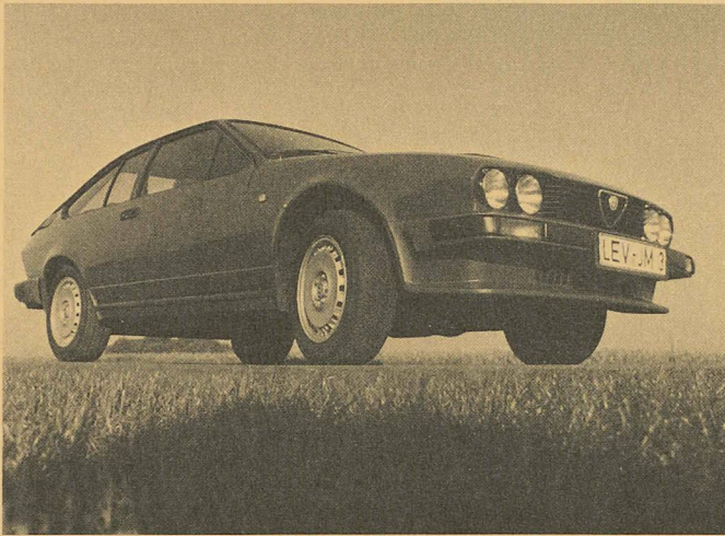
Par l'utilisation de 35 kg de polyuréthane, l'Alfa Romeo présente une résistance améliorée aux assauts du temps ainsi qu'une diminution de poids non négligeable.

bouillage du tableau de bord, les accoudoirs, les appuie-tête ou le pommeau du levier de vitesse ou le rembourrage des sièges, dans le cas de l'Alfa Romeo GTV. Ce modèle étant conçu pour durer, il convient de fabriquer le plus grand nombre possible d'éléments en matière ne nécessitant pas d'entretien et insensible aux chocs, aux intempéries et à la corrosion. Ces conditions sont remplies par le Bayflex® de Bayer. Son utilisation conduit de plus à une réduction de poids notable par rapport aux matériaux usuels, de sorte qu'à puissance égale la consommation d'essence en est diminuée. Alors que les éléments extérieurs doivent résister tant aux chocs qu'aux intempéries, les pièces intérieures ont pour rôle de protéger les occupants contre les conséquences d'accidents éventuels, donc d'amortir les impacts. L'amortissement des vibrations et une faible transmission est une caractéristique supplémentaire bienvenue.