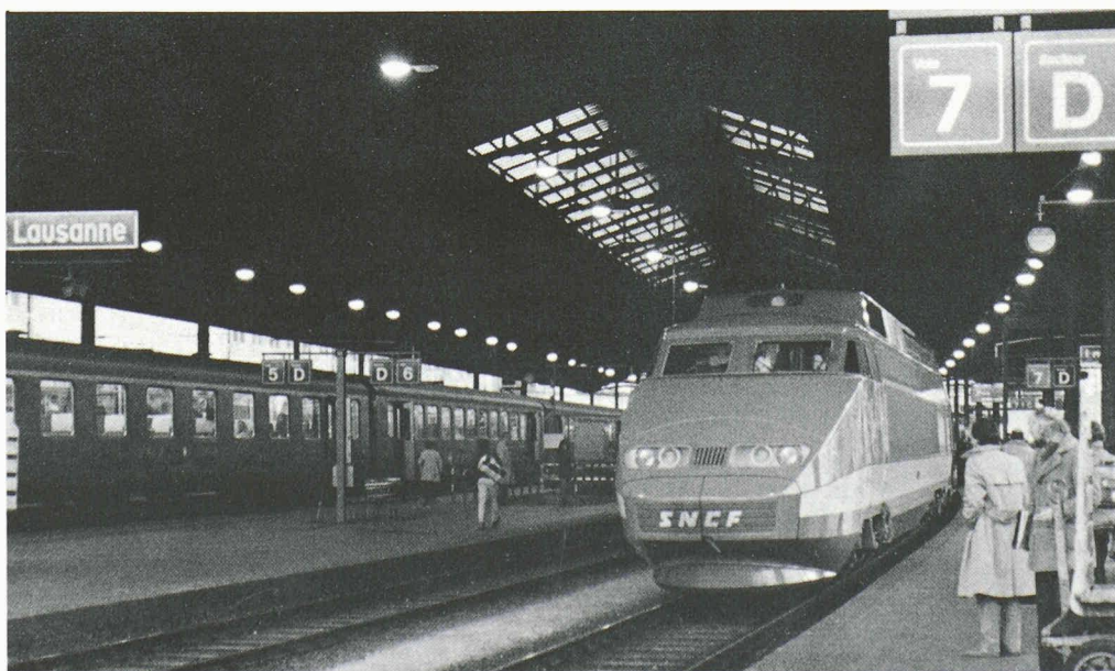
Spectacle quotidien dès le 22 janvier: départ matinal du TGV à Lausanne.