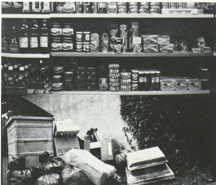
Un cycle intempestif et superflu.

Jean-Jacques Sauer, collaborateur scientifique IREC-EPFL Av. de l'Eglise-Anglaise 12 1006 Lausanne