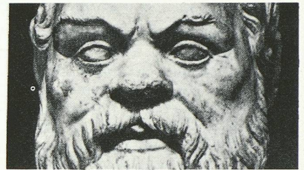
Avant le nez de Cléopâtre, celui de Socrate.