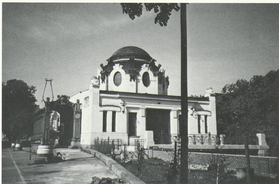
Station de métro dite «des Rois», à Schönbrunn (Otto Wagner).