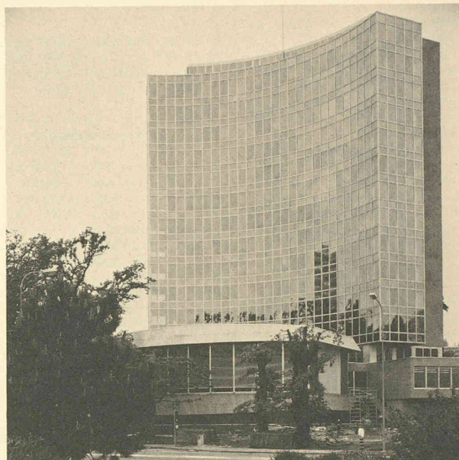
La tour de l'Organisation mondiale de la propriété intellectuelle (OMPI). Architecte: Pierre Braillard, Genève.

Une autre possibilité existait en utilisant des plans courbes qui détruisent l'effet de miroir pour ne retenir que l'effet de lumière. Or, par nature, la lumière change d'un instant à l'autre, donnant une vie intense à ce qui est terne, voire mort avec d'autres matériaux.