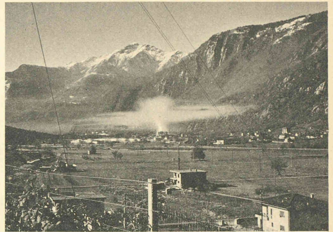
Stagnation des polluants atmosphériques dans une vallée.

L'Institut du génie de l'environnement de l'Ecole polytechnique fédérale de Lausanne organise, pour la période de janvier 1988