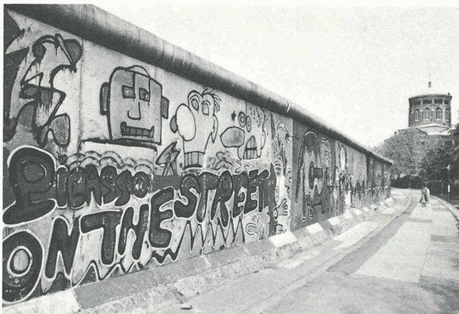
Le Mur: support de l'expression artistique populaire; à ce titre, double témoignage d'une époque.