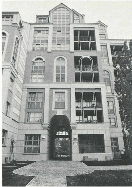
Architecture dans le cadre de l'IBA : la nostalgie n'est plus ce qu'elle était.