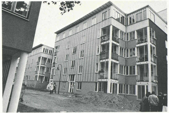
Deux exemples de réhabilitation urbaine à Kreuzberg par le bureau Stern.

précédemment au Kunstgewerbemuseum de Zurich.