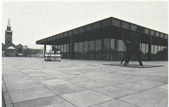
Neue Nationalgalerie, 1962-1963. Ludwig Mies van der Rohe, architecte. À gauche, la Mathäuskirche.