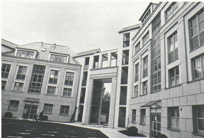
Architecture dans le cadre de l'IBA : historicisme ou futurisme ?

Il faudrait aussi consacrer une étude complète aux œuvres de Hans Scharoun, et tout particulièrement au bâtiment de la Philharmonie. Ce vaste vaisseau aux façades jaunes est d'un abord surprenant. Mais il faut s'y rendre un soir de concert, pénétrer dans le hall, aux circulations généreuses, où il est aussi aisé de voir que d'être vu... Les Berlinoises et les Berlinoises en font un haut lieu qu'il est de bon ton de fréquenter en toilettes élégantes, ou en accoutrements excentriques ; on peut y croiser des dames d'un âge certain