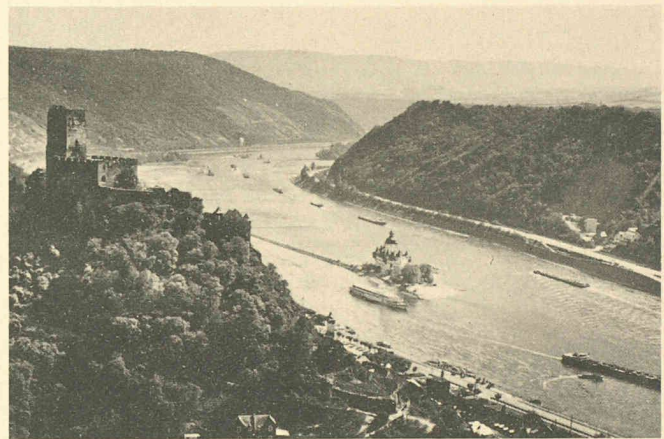
Deux aspects de la Rhénanie : zone industrielle de Leverkusen, avec le complexe chimique Bayer (en haut) et le site romantique du Rhin près de Kaub, avec le château de Gutenfels et l'ancien péage du château de la « Pfalz », au milieu du fleuve, avec son donjon à cinq pans cerclé d'une enceinte à tourelles.