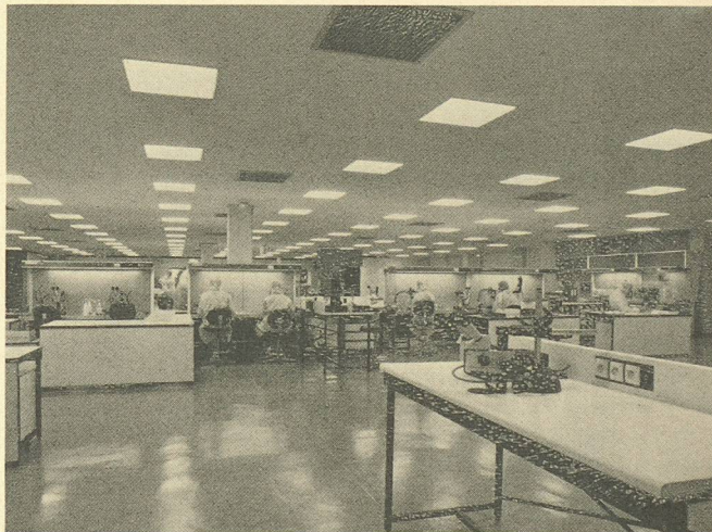
Local de production avec soufflage d'air par le plafond. L'air extrait est évacué par les gaines montées sur les parois arrière des salles.

L'installation est commandée et contrôlée à partir d'un système de télégestion SICOS® 2000 (technique DDC - Direct Digital Control), raccordé à la succursale Sulzer de Marseille/Provence dont le poste central est opérationnel 24 heures sur 24.