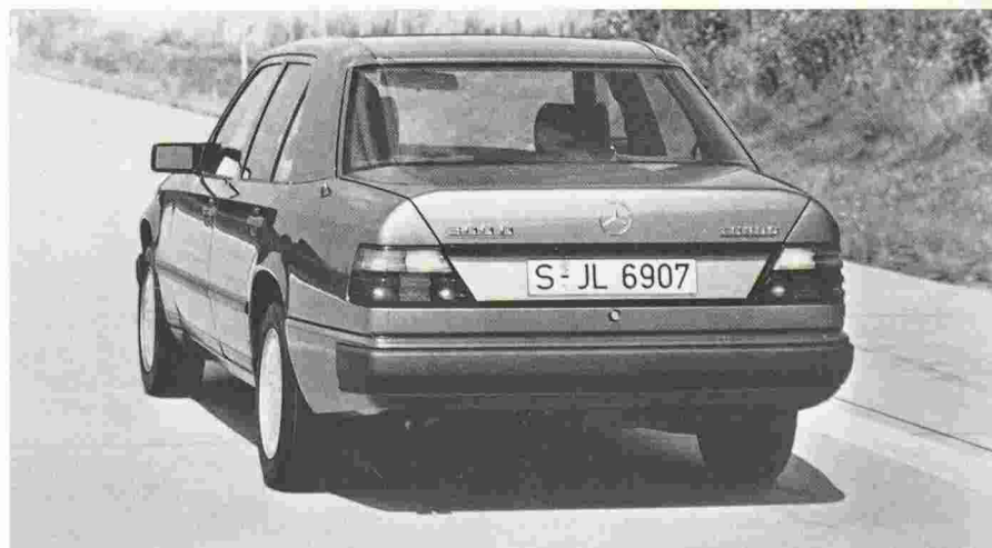
Fig. 1. - Doyen des fabricants de moteurs Diesel dans le monde entier, Mercedes-Benz poursuit la mise au point de moteurs à allumage spontané par compression, avec réduction des émissions nocives. Ici, un modèle de la gamme 190 D/300 TD Turbo.

elles soutiennent parfaitement la comparaison avec celles que produit un moteur à allumage par étincelle équipé d'un catalyseur régulé (à trois voies). Autre point sur lequel les fabricants vont devoir s'efforcer d'améliorer aussi le moteur Diesel: celui de ses émissions sonores. Selon un sondage réalisé en 1987 en République fédérale d'Allemagne, c'est la circulation routière qui est considérée comme la nuisance de bruit principale. Et plus de 9% des Allemands, c'est-à-dire plus de 5,5 millions de personnes, se sentent importunés par un niveau sonore trop