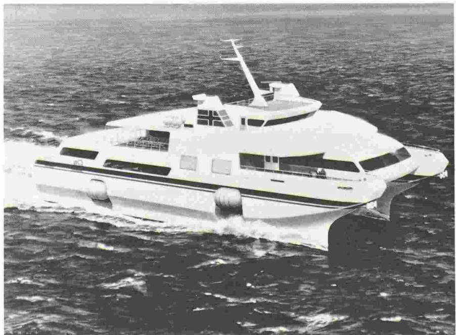
Le «bac de demain» sur coussin d'air.

Autre constructeur et autre mode de propulsion aquatique, la Motoren- und Turbinen-Union de Friedrichshafen, qui appartient au groupe Daimler-