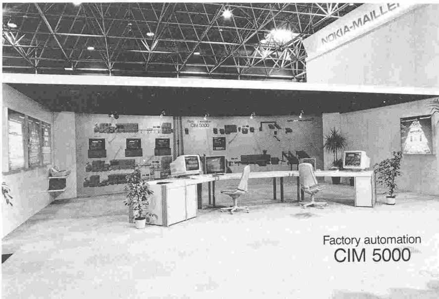
Fig. 3. - Wirex 1990.

CAM 5000 (Computer Aided Manufacturing), intégrant lignes d'extrusion, cellules de production et machines individuelles.