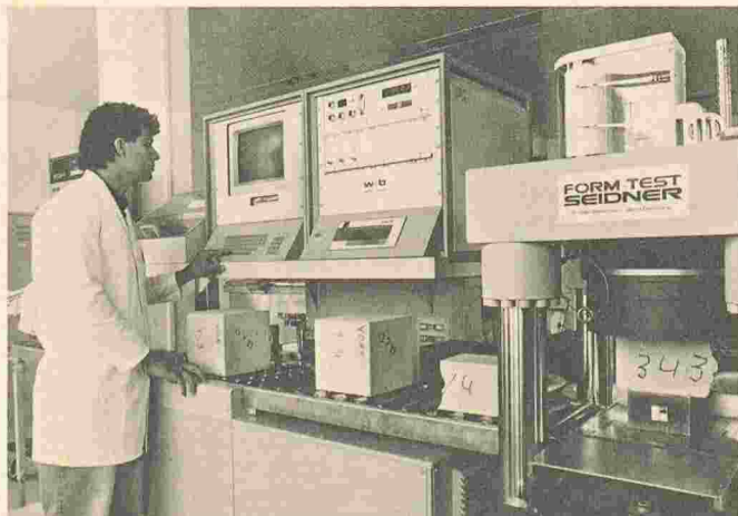
Le nouveau centre MBT de Zurich-Schlieren. Ici, le laboratoire du béton.

Bosch commencera cet été à produire les premiers réfrigérateurs et congélateurs avec mousse sans hydrocarbures chlorofluorés, dans son usine de Giengen/Brenz (RFA).