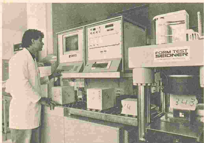
Le nouveau centre MBT de Zurich-Schlieren. Ici, le laboratoire du béton.

Bosch commencera cet été à produire les premiers réfrigérateurs et congélateurs avec mousse sans hydrocarbures chlorofluorés, dans son usine de Giengen/Brenz (RFA).