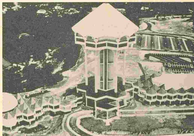
Centre civique à Kuching, sur l'île de Bornéo (Malaisie).

Le Bulletin Sandoz 80 avait présenté l'entreprise Master Buil-