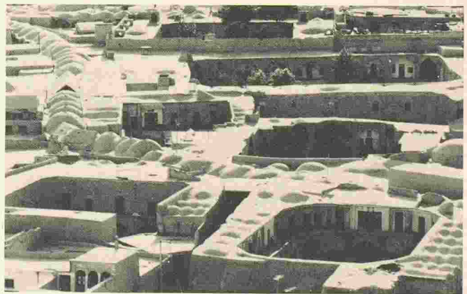
Isfahan, Iran: le Grand Bazar à la recherche de son chemin à travers les caravansérails, les mosquées et la structure urbaine.

Heures d'ouverture: du lundi au vendredi de 8 à 19 heures.