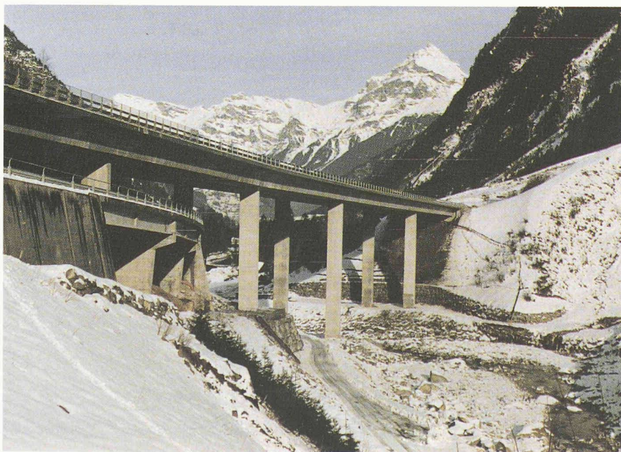
Fig. 4. - Le pont reconstruit.

Adresse de l'auteur: Heribert Huber Ing. civil dipl. EPF/SIA Ingénieur des ponts 6460 Altdorf