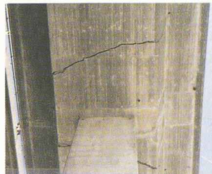
Fig. 2. – Le pont endommagé à la suite d'intempéries.

La seule liaison restante devant être préservée coûte que coûte, l'adoption des mesures d'urgence devint un défi d'une portée hors du commun. Ainsi, la décision de remblayer la fondation de la pile affaissée et tordue et d'étayer le mur de soutènement par un remblai de 15\,000 \text{ m}^3 représentait une mesure audacieuse, qui fut réalisée au cours d'une action spectaculaire. 21 camions ont circulé 18 heures par jour pendant 4 jours pour apporter la formidable quantité de pierres et de matériaux de remblai que trax et pelles mécaniques mettaient en place. Le 29 août, quatre jours seulement après le premier point de la situation, le pont sur la Reuss à Wassen était préservé de l'effondrement.