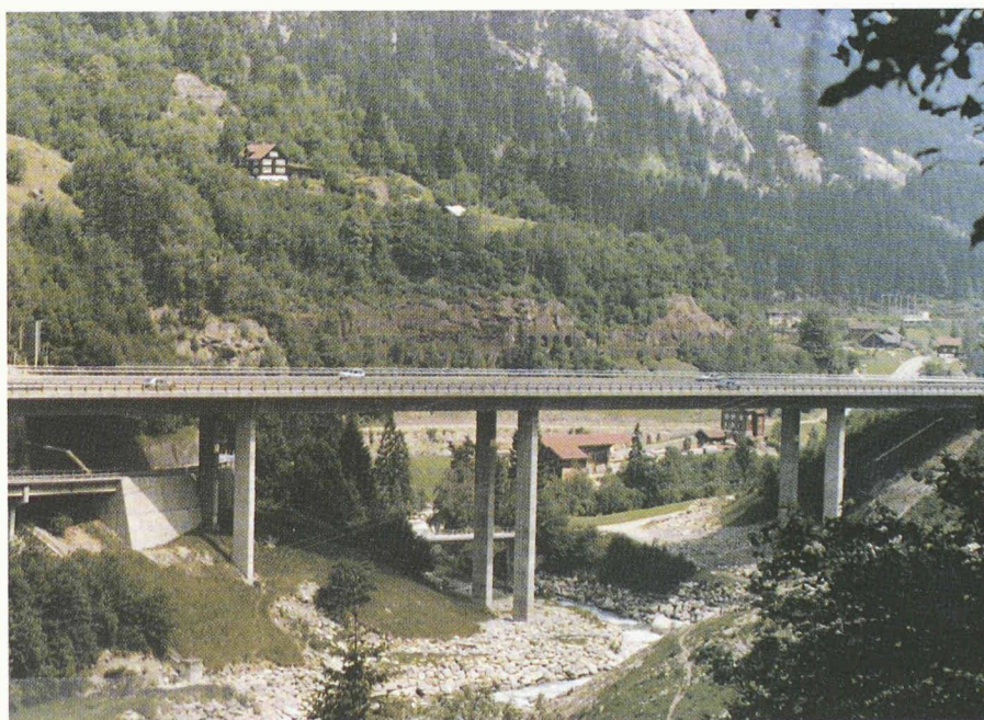
Fig. 1. – La Reuss et le pont de Wassen avant les intempéries de 1987.

Dans le même temps, il a bien sûr fallu élaborer des mesures de protection contre les crues de la Reuss. Celles-ci