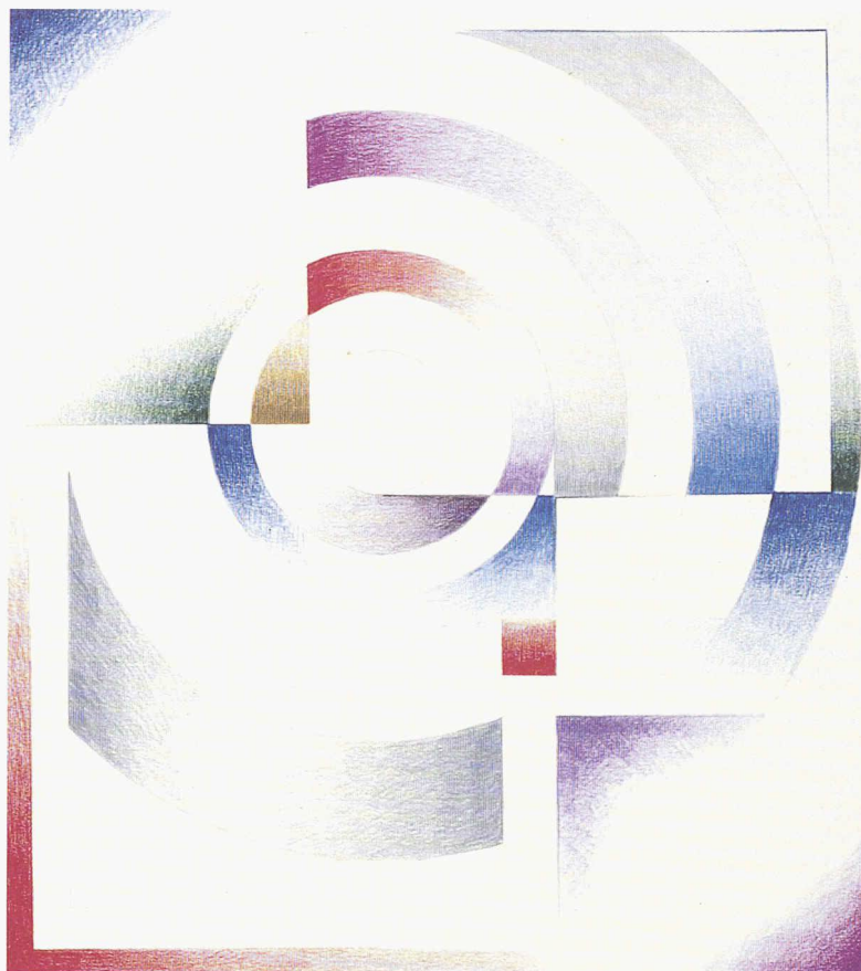
Folie mesurée, 1993, 24 x 31,5 cm