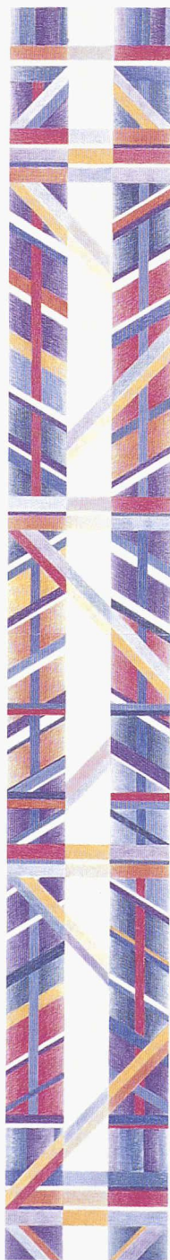
Venise, 1995, 130 x 21 cm