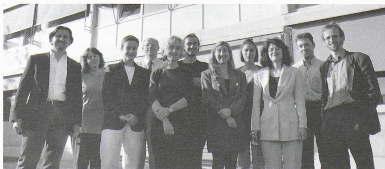
La première volée du cycle postgrade en architecture et développement durable a défendu ses travaux de maîtrise avec succès.