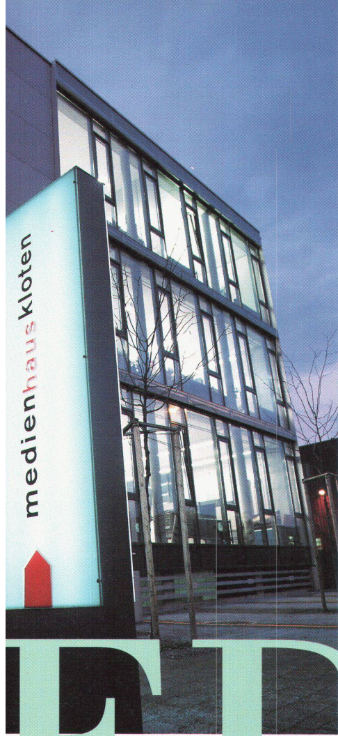
Medienhaus Kloten: 8 sociétés en réseau sous un même toit. Installation: E. Schibli AG, Kloten